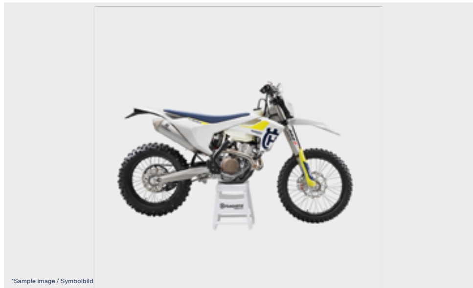
*Sample image / Symbolbild