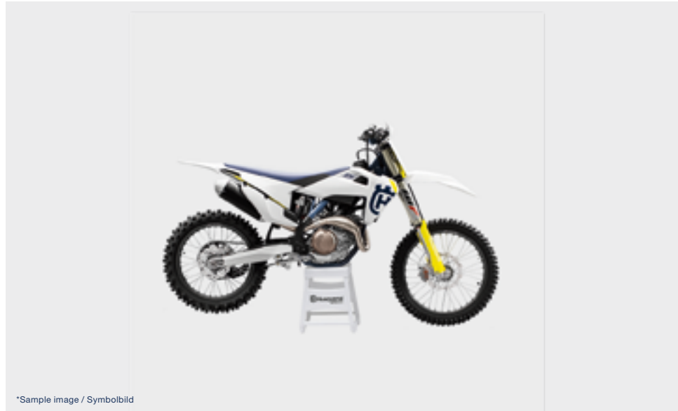
*Sample image / Symbolbild